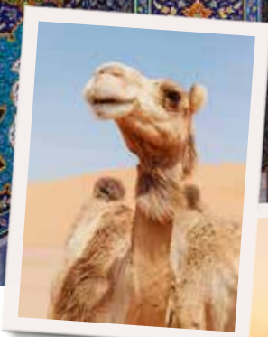
Kamele sind der Stolz der Omaner (o). Imposanter Sonnenuntergang bei al-Hamra.